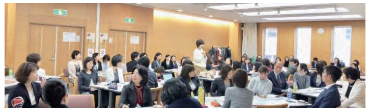
自由にネットワークを広げていただく時間

最後は自由にネットワーキングしていただく時間を設けています。第1部の内容をもう少し詳しく聞きたいということであれば、その担当者の方に直接詳しく伺っていたり、今後に繋がる交流の時間にしていただければと思います。