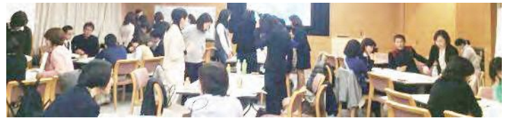
自由にネットワークを広げていただく時間

最後は自由にネットワーキングしていただく時間を設けています。第1部の内容をもう少し詳しく聞きたいということであれば、その担当者の方に直接詳しく伺っていただいたり 今後に繋がる交流の時間にしていればと思います。