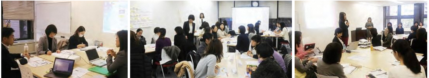
京都ウィメンズベースアカデミーでの様子