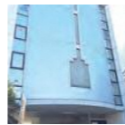
葛城 佐栄子さん 株式会社かつらぎ 取締役

京都ウィメンズベース事業に関する 面接相談 月～金 9:00～17:00 ※祝日は除く 要予約